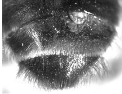
Abb. 2. Abdomen eines stylotisierten ♀ von Andrena nitida .

nicht verwunderlich, da diese nicht nur auf Grund ihrer geringen Größe, sondern auch wegen ihrer Lebensweise nur selten nachgewiesen werden. Nach Kinzelbach & Pohl (2003) beträgt die Lebenserwartung der männlichen Imagines nur wenige Stunden.